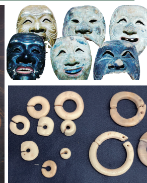
上:能面(東近江市様) 下:けつ状耳飾(あわら市様)