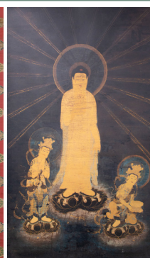
阿弥陀三尊来迎図